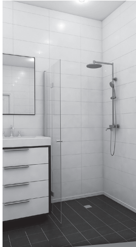
Taittuu seinää vasten!